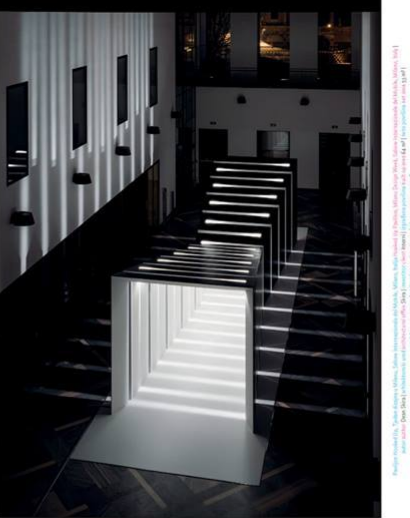
040 DEAN SKIRA, Pavilion Hooked Up